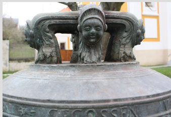
2. Weinbert, Peter (pécsi harangöntő, 1802 – 1841 között): Harang, 1808 (a bükkösi római katolikus templomból) (bronz, öntött, magasság: 95 cm, átmérő: 105 cm)