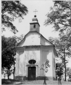
archív felvételeken, 1960-as évek