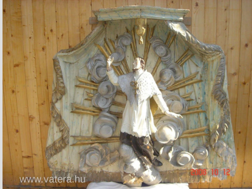
internetes kínálatban, 2015. április