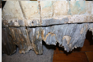
szemeállapot, 2015. május