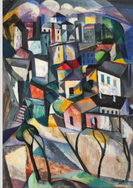
1. Schönberger Armand (Galgóc, 1885 – Budapest, 1974): Út és házak (papírlemez, olaj, 99 x 70 cm, jelezve jobbra lent: „Schönberger A. 1929”)