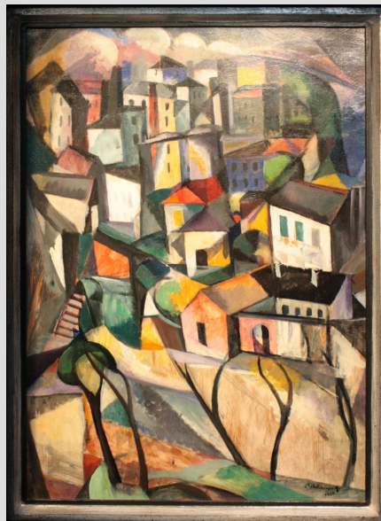
1. Schönberger Armand (Galgóc, 1885 – Budapest, 1974): Út és házak (papírlemez, olaj, 99 x 70 cm, jelezve jobbra lent: „Schönberger A. 1929”)